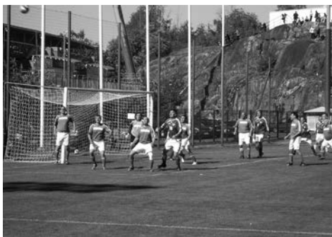
Gefahr vor dem Schweizer Goal – eine spannende Szene aus dem letzten Turnier in Finnland.

Fussballteams der nationalen Parlamente Österreichs, Deutschlands, Finnlands und der Schweiz messen sich jährlich an einem internationalen Parlamentarier-Fussballturnier. Dieses Jahr ist der Austragungsort des 40. Parlamentarier-Fussballturniers Tampere. Den Schweizern scheint der finnische Boden übrigens gut zu behagen, denn die beiden letzten Turniere in Finnland (Hyvinkää 2004 und Helsinki 2008), waren für die Schweizer erfolgreich: Beide Male durften sie mit einem stolzen Turniersieg nach Hause reisen.