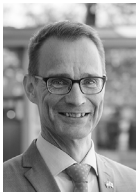
Schweizerischer Honorarkonsul Heikki Ilvespää

Der Schweizerische Botschafter Heinrich Maurer