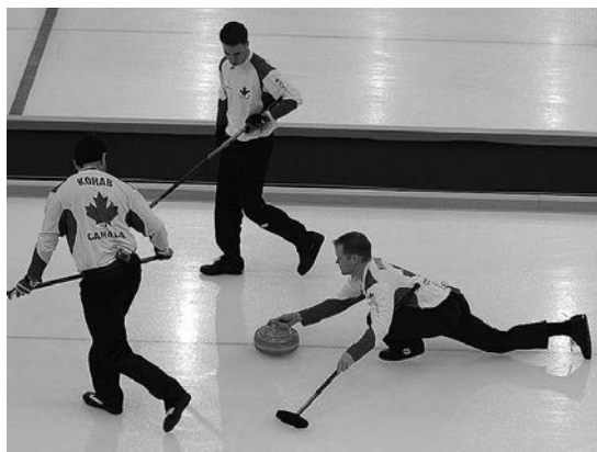
Team Kanada in Aktion

Die Anmeldungen werden in der Reihenfolge des Eingangs akzeptiert. Wenn die Gruppe voll ist, gibt es eine Warteliste. Bei zu wenig Anmeldungen wird der Anlass nicht durchgeführt. Die Teilnehmer/innen müssen selbst gegen Sportunfälle versichert sein.